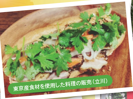
東京産食材を使用した料理の販売(立川)