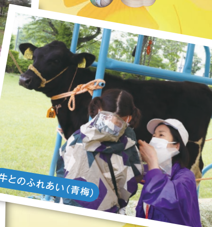
牛とのふれあい(青梅)