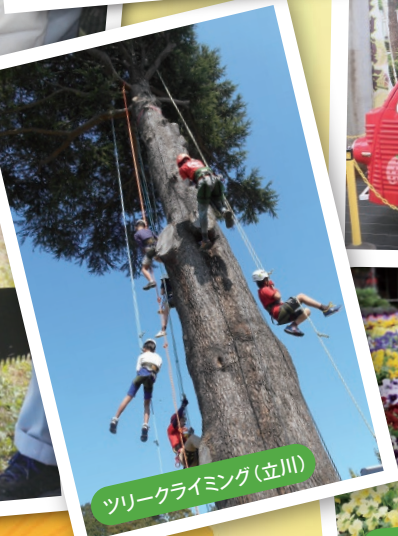
ツリークライミング(立川)