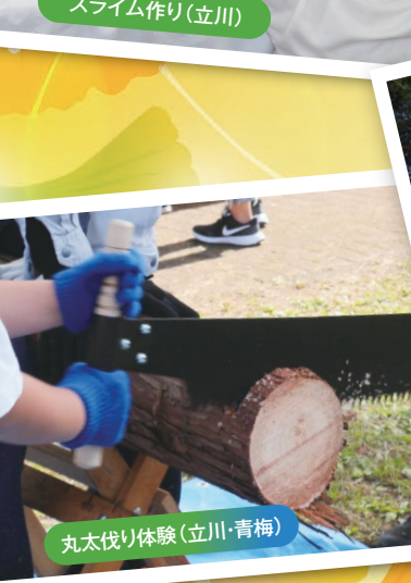
丸太伐り体験(立川・青梅)