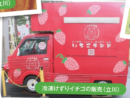
冷凍げずりイチゴの販売(立川)