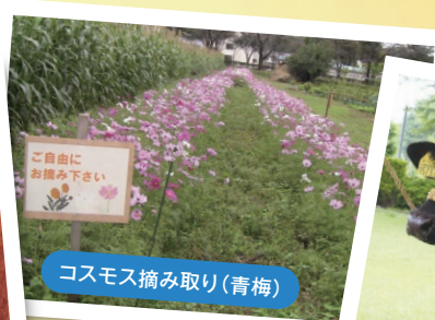
コスモス摘み取り(青梅)