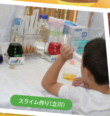
スライム作り(立川)