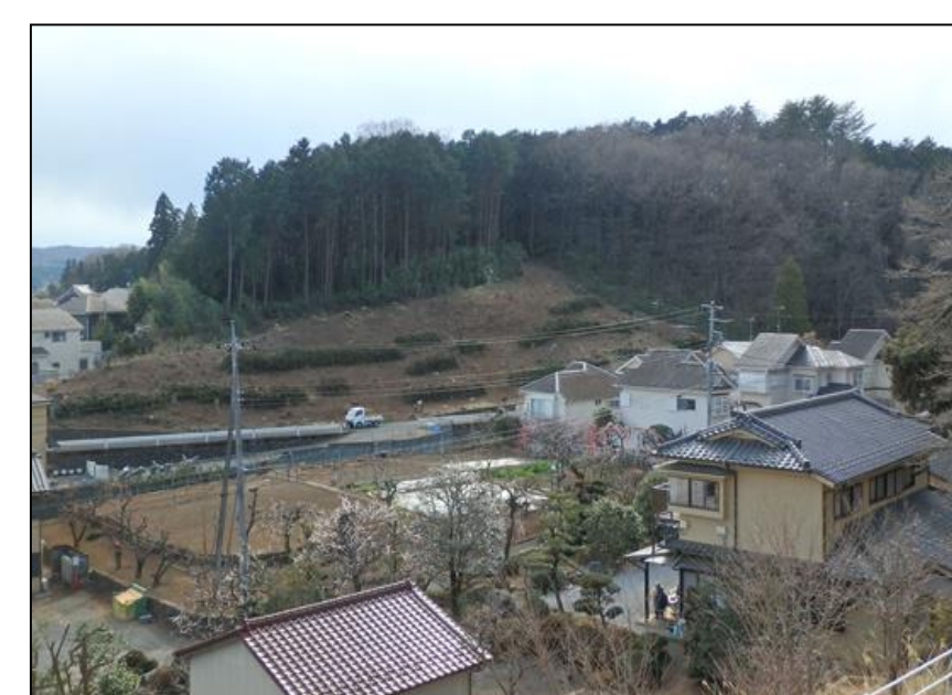
③ 伐採後(遠景) H29年3月撮影