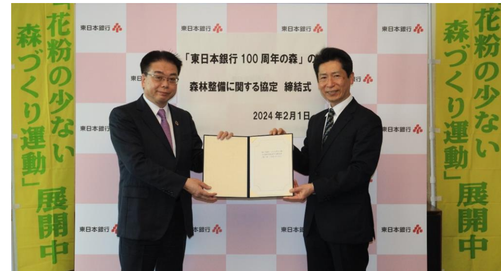
協定締結式 2024年2月撮影