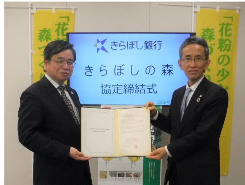
協定締結式 (平成31年3月28日)