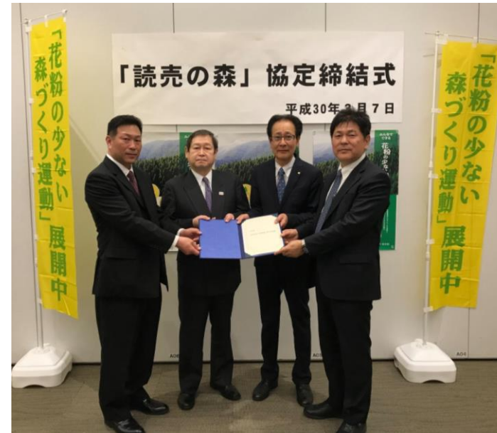
協定締結式(2018年3月7日)