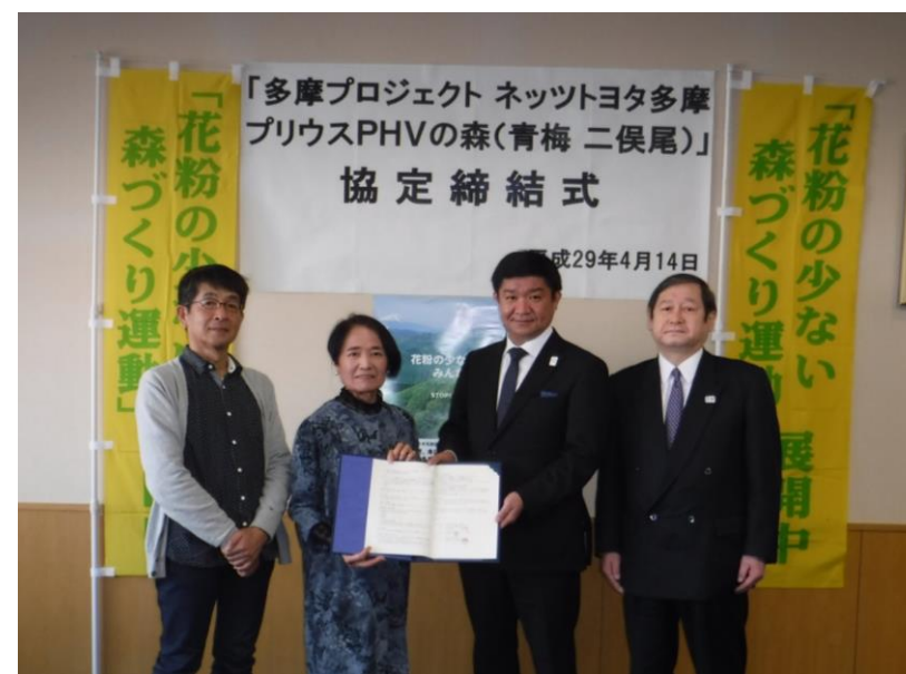
協定締結式(2017年4月14日)