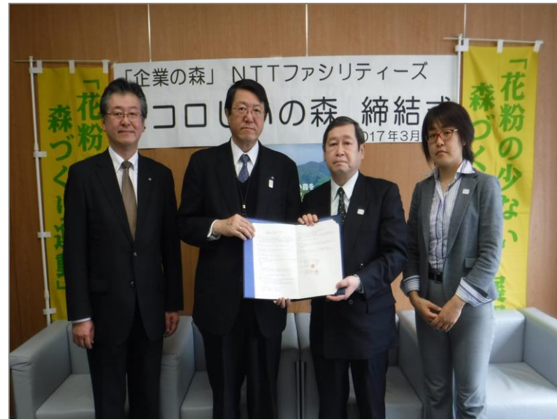
協定締結式(平成29年3月23日)