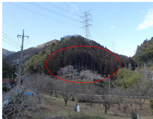
① 対象地 伐採前 (2015年3月撮影)