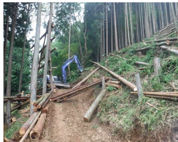
② 対象地 伐採中 (2015年8月撮影)