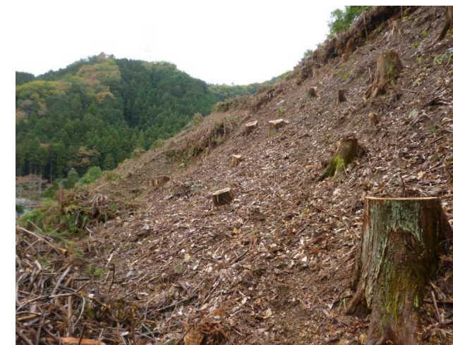
③ 対象地 伐採後 (2015年11月撮影)