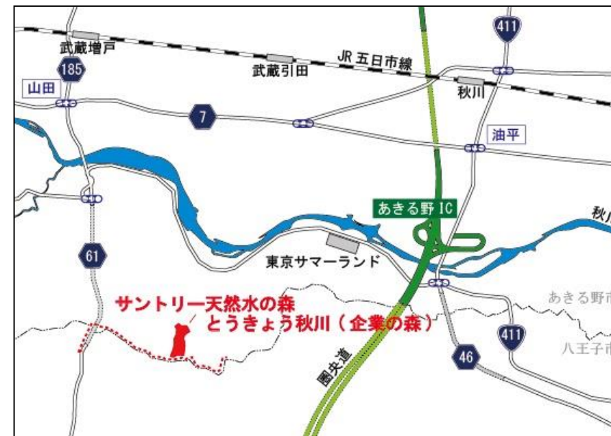
サントリー天然水の森 とうきょう秋川（企業の森）