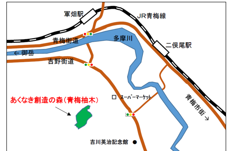
企業の森・あくなき創造の森(青梅柚木)