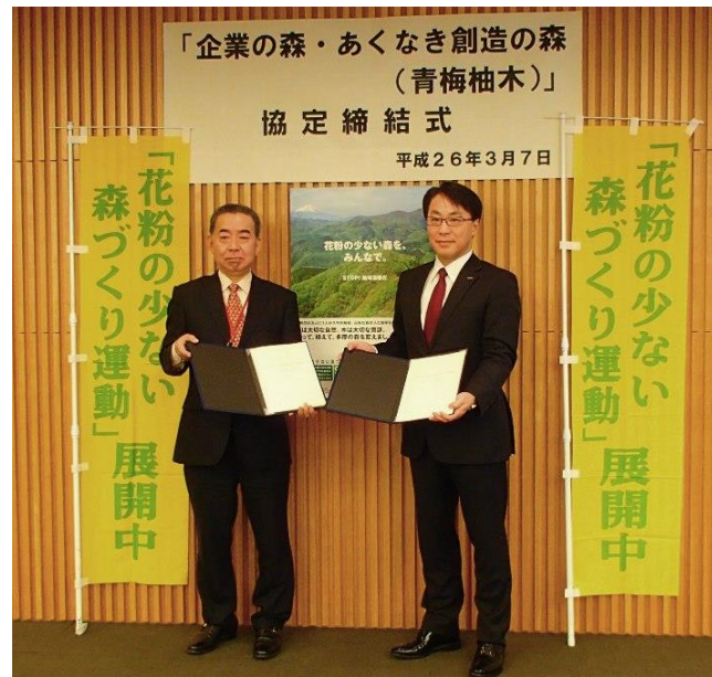
協定締結の様子 (H26. 3. 7)