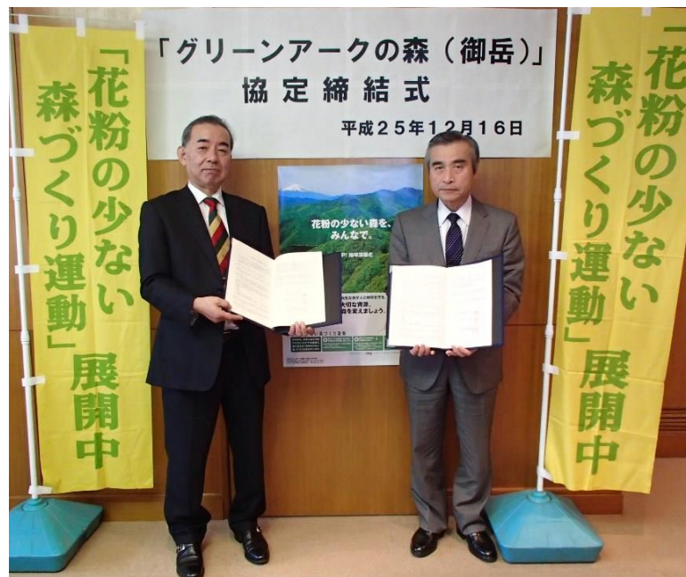
協定締結の様子 (H25. 12. 16)