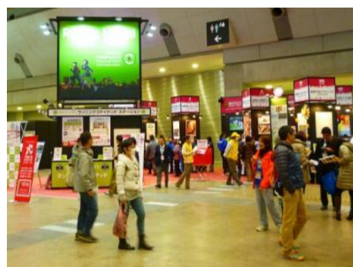
チャリティ “つなく” ブース周辺