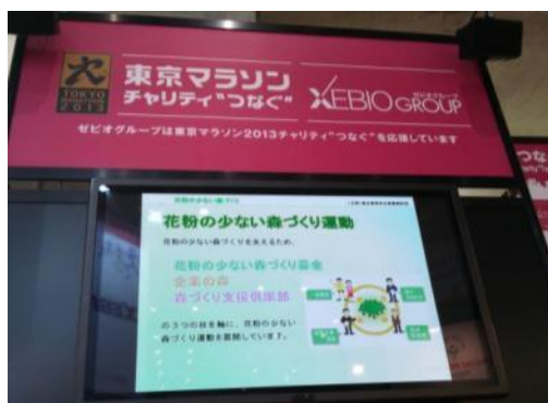
映像による事業紹介