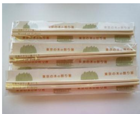
ノベルティ配布 （東京の木の割り箸）