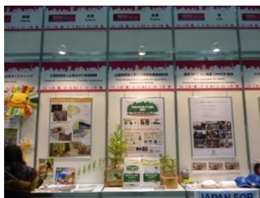
フィニッシュ会場における チャリティ事業 PR 展示コーナー