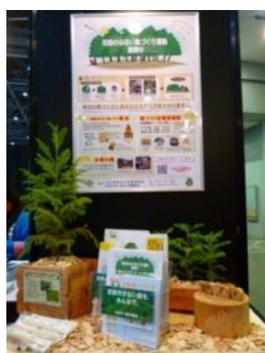
花粉の少ない森づくり PR 展示