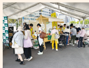
花粉の少ない森づくり運動PRブース