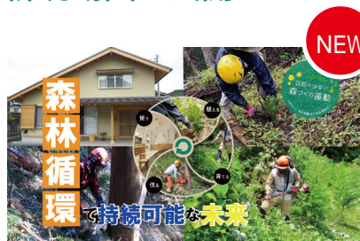
第14弾「森林循環で持続可能な未来」