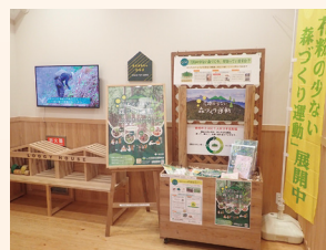
花粉飛散時期PRブース