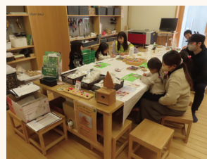
檜原森のおもちゃ美術館