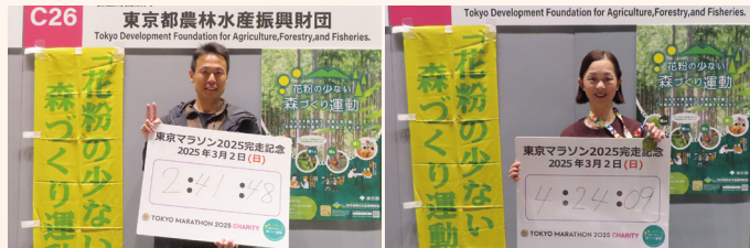
大会当日フィニッシュラウンジの様子