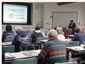
花粉の少ない森づくり講座