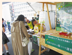
ルーレットゲーム