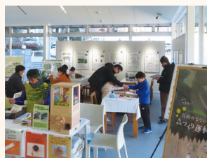
高尾599ミュージアム

また、都内各所において、ポスターの掲示をはじめ、PRブースやチラシを設置し、花粉の少ない森づくりの周知活動を実施しました。