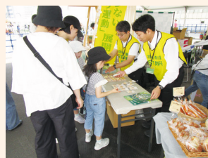
木工品プレゼント