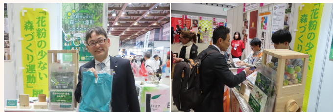
東京マラソンEXPO会場の様子

3月3日(日)の大会当日はチャリティラウンジを設け、フィニッシュ後のチャリティランナーを迎え、記念撮影をしながら交流を深めました。