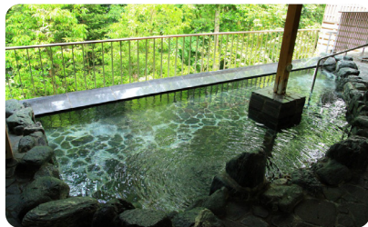
目の前に広がる緑豊かな露天風呂