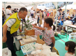
少花粉スギの苗でPR