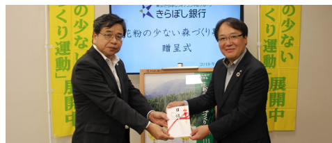
(右)株式会社きらぼし銀行 強瀬常務執行役員、(左)当財団理事長