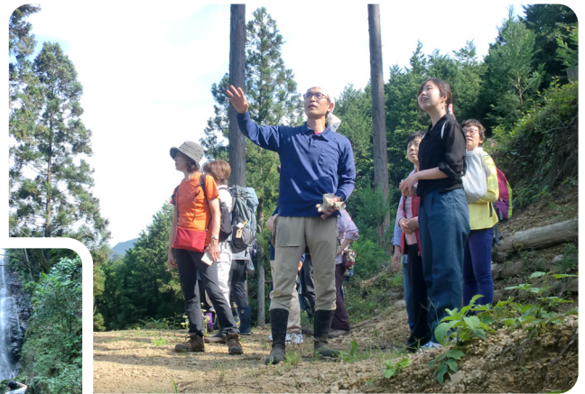
先人達から受け継がれた森の木々。未来につなげる大切な事を伝えます。

プロの手によって管理されている山を歩く体験は、いかがでしたでしょうか。ふだん何気なく目にする森や木も、子供を慈しみ育てるように、大事に保育されているんですね。多摩産材の木は、建築材や家具、木工に使用されるまでに、たくさんの人たちの手によって大事に育てられた木なのです。