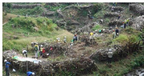
植樹イベントの様子