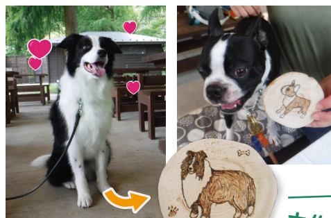
多摩産材のテーブルと椅子が置かれたコミュニティエリアで開催