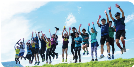
ジャンプ5回目、すばらしい写真が撮れました！