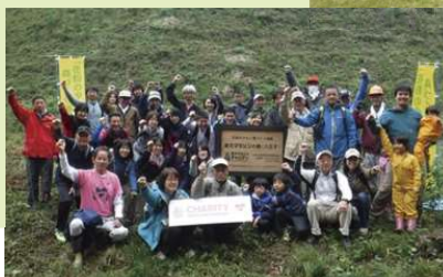
10月30日のイベント参加者の皆さん