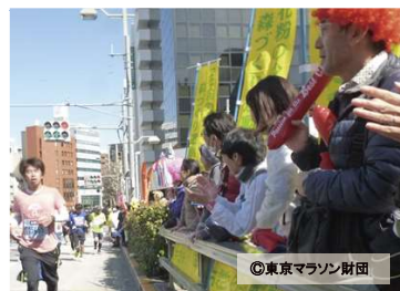
応援スポット（茅場町）

茅場橋（27.5km）と芝公園（33.0km）の2箇所に応援スポットを設けました。チャリティランナーのご家族ご友人も駆けつけ、沿道から身を乗り出してランナーの皆さんを応援しました。