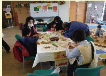
3月4日(土) 道の駅八王子滝山