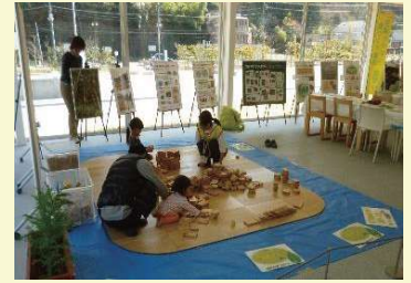
3月18日(土) TAKAO 599 MUSEUM