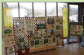
道の駅八王子滝山