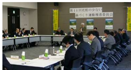
推進委員会の様子

これらの運動を着実に推進し、実効性のある対策を検討・協議するため、第11回「花粉の少ない森づくり運動」推進委員会が1月24日に開催されました。