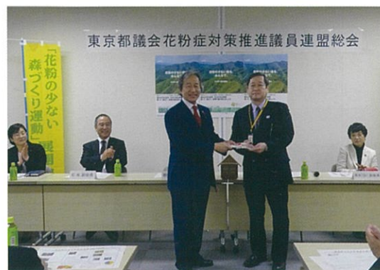
東京都議会花粉症対策推進議員連盟総会