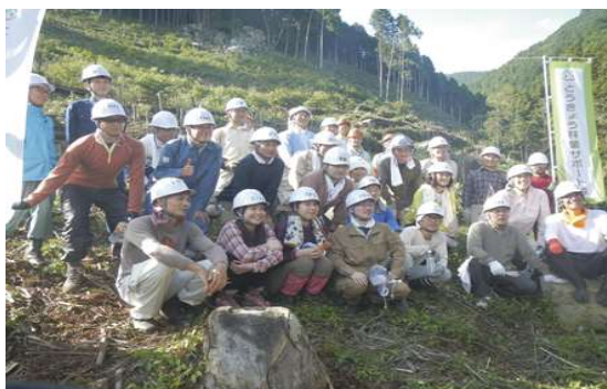
とうきょう林業サポート隊メンバー

メンバーの募集にあたっては、ミス日本みどりの女神を起用したポスター、チラシを作成し、都内各所に配布しました。また、親しみのあるロゴマークを作ることでサポート隊そのもののイメージづくりをしています。さらに洗練されたデザインのWEBサイトを立ち上げ、WEBサイトから登録や活動への参加申込ができるように工夫し、