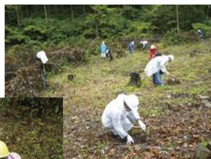
石の多いところもありましたが、ヤマザクラの苗木を1本1本植え付けました。