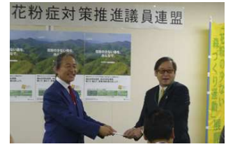
東京都議会花粉症対策推進議員連盟

いただいた募金は花粉の少ないスギへの植え替え等に活用させていただきます。ご協力ありがとうございました。