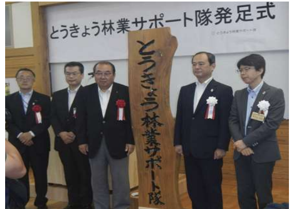
とうきょう林業サポート隊発足式

若年層にもアピールする仕組みを用意しました。そのかいあってか、メンバーの登録者数は、9月末現在180名を超え、現時点でも順調に増えております。年齢層も10代から70代までと幅広く女性も2割を超えています。