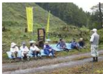
「多摩の森」についての講話