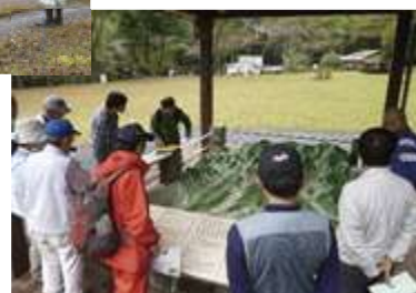
八王子城跡ガイド (立体模型の屋外展示)