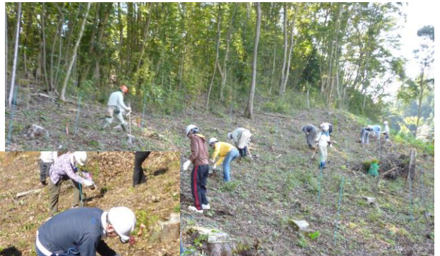
数十年後の森の姿を 楽しみにしながら植樹

当日は、10月とは思えないほどの30度を超える暑さとなりました。参加者の皆さんは、暑さと慣れない作業に苦戦しながらも積極的に取り組み、見事、200本のイロハモミジを植え終えることができました。