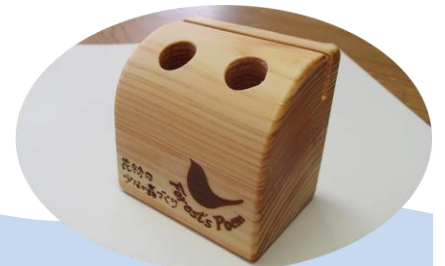
お土産の多摩産材木工品