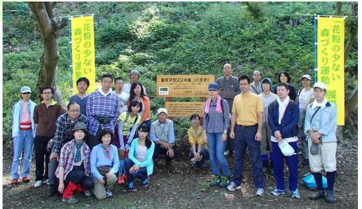
「力を合わせて良い森に！」

八王子市下恩方町にある「東京マラソンの森（八王子）」にて、第2回目の植樹会が行われました。