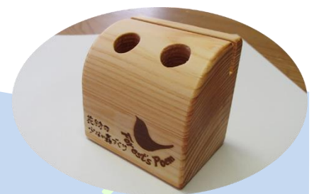
参加記念品のペン立て (多摩産材木工品)