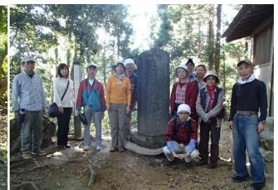
八王子城跡ガイドウォーク (本丸跡)