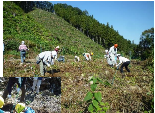
森の未来を思いつつ苗木を一本一本植え付けました。

雲ひとつ無い秋晴れの下で植樹体験を行いました。植樹地には石が多く、掘りづらさに苦戦することもありましたが、指導員の指導の下、予定した240本の広葉樹を植え終えることが出来ました。植樹後には、これからの木の成長や花粉の少ない森づくりがどうなっていくのかが楽しみだ、などが話題になっていました。