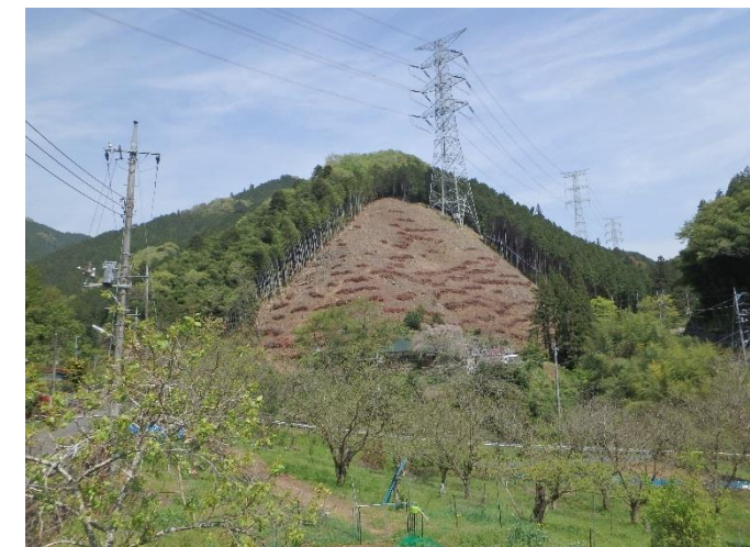
③ 対象地 伐採後 (H28年4月撮影)