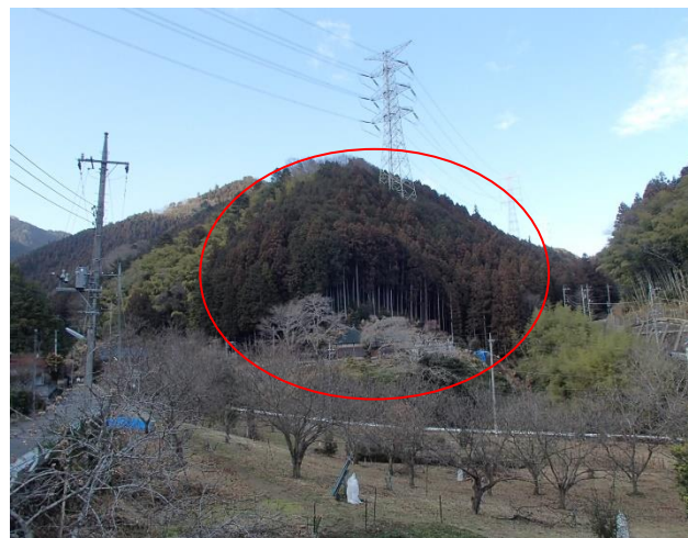
① 対象地 伐採前 (H27年3月撮影)