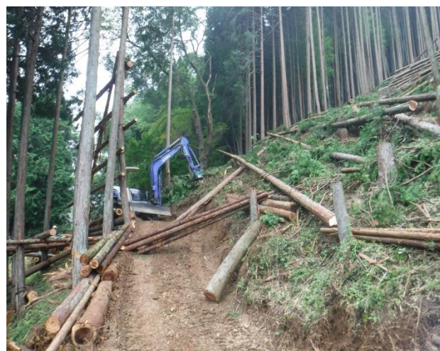
② 対象地 伐採中 (H27年8月撮影)