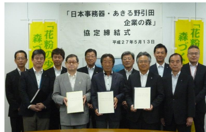
協定締結式（平成27年5月13日）