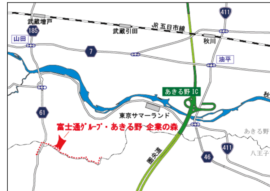
富士通グループ・あきる野 企業の森