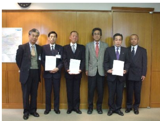
第3号「武蔵野水道・時坂の森」