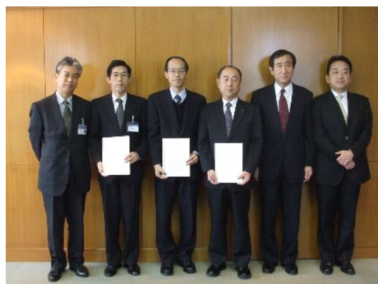
第4号「企業の森・黒田電気（青梅）」