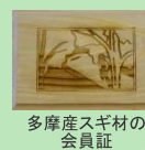
多摩産スギ材の会員証