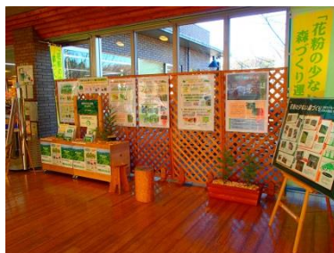
道の駅 八王子滝山