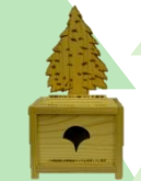
多摩産スギ材の募金箱