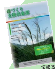
情報満載の会報誌(年4回以上発行)

花粉の少ない森づくり運動を継続的に支援する会員制の組織です。会費は、花粉の少ない苗木の購入や運動のPRに使われます。