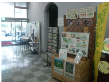
エコギャラリー新宿