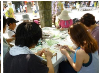
多摩産材キーホルダーやコースターへの焼き付け体験