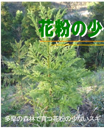
多摩の森林で育つ花粉の少ないスギ

東京都と(公財)東京都農林水産振興財団では、都民や企業の方々に「花粉の少ない森づくり」への参加・協力を呼びかける「花粉の少ない森づくり運動」を展開しています。都民の方々に花粉の少ない森づくりについてのご理解、ご協力をいただくことを目的として、スギ花粉の飛散時期にイベント等を実施し、PRを行いました。