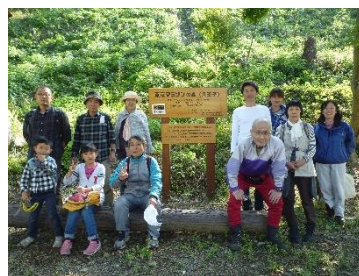
自然観察ガイドウォーク

午後からは、昨年までの植栽地における自然観察と八王子城跡の二つのコースに分かれてガイドウォークを行いました。自然観察コースでは、植樹から1～2年が経過した苗木の成長を確認したり、植栽地からの眺望を楽しみました。また、城跡コースでは、植栽地周辺の森林と八王子城の石垣など、当時の面影を残す登山道の散策を楽しみました。