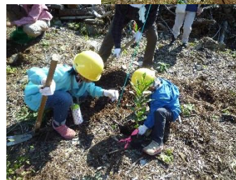
森の未来を思いつつ苗木を一本一本植え付けました。

午後からは、昨年までの植栽地における自然観察と八王子城跡の二つのコースに分かれてガイドウォークを行いました。自然観察コースでは、植樹から1～2年が経過した苗木の成長を確認したり、植栽地からの眺望を楽しみました。また、城跡コースでは、植栽地周辺の森林と八王子城の石垣など、当時の面影を残す登山道の散策を楽しみました。