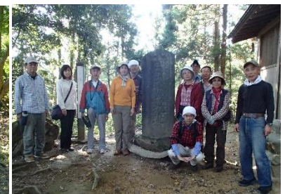
八王子城跡ガイドウォーク（本丸跡）